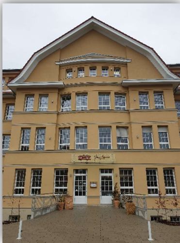
Café Argenta „GenussMomente“ Wernigerode